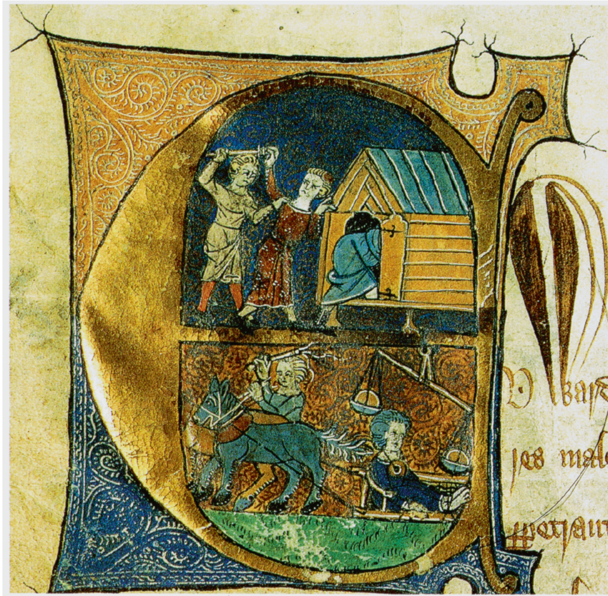
Fig. 1 Cette illustration qui provient du bureau des archives de la ville de Bristol au Royaume-Uni représente un boulanger puni pour avoir enfreint les ordonnances de l'État. Le boulanger y est représenté sur un petit traîneau traîné par un cheval à travers la ville, le pain frauduleux attaché autour du cou. | An illustration from the City of Bristol Records Office in the U.K., illustrating a baker being punished for violating State ordinances. The baker is shown with the fraudulent bread attached to his neck as he is dragged through town behind a horse on a small sledge.